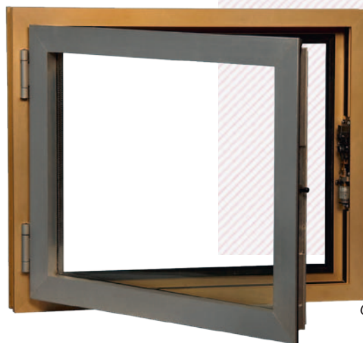
Ouvrant à la Française